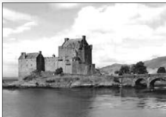
Skotland er fyldt med spændende fortidsminder, ikke mindst den lille ø Islay. Her Eilean Donann.

Når kendere skal vælge whisky, er det altid Malt, og »those in the know« vil næsten altid ende med den legendariske Islay Malt.