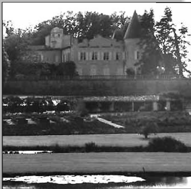
Médoc -Lafite-Rothschild. Herfra kommer nogle af Verdens bedste (og mest kostbare) Cabernet-vine.