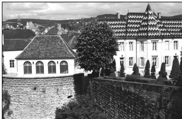
Château de Beaune blev opført af kongen, da hertugdømmet Bourgogne blev del af Frankrig.

»Gennem alle tider har prinser, købmænd, soldater og lærde på et eller andet tidspunkt set Côte d'Or, rastet i Beaune eller Dijon og smagt og fået fortalt sære beretninger om de fabelagtige vine, der kom fra de smalle, kratbevoksede dalskræninger... På særlige lokaliteter og i særlige år opnår Pinot Noir og Chardonnay aroma, der er blandt de mest værdsatte i Verden... Artiklen her skal hverken være en afhandling eller en historisk udredning, blot et portræt; og maleren er forelsket i sin model« -Hugh Johnson.