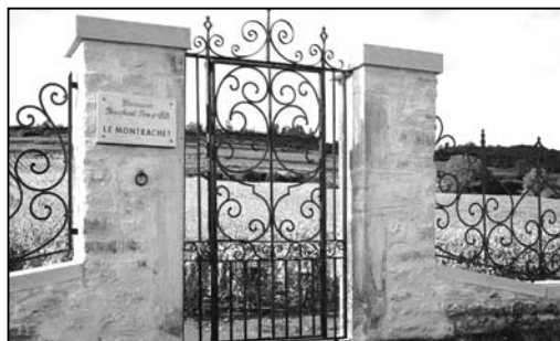
Indgangen til le Montrachet, Grand Cru i Puligny Montrachet.