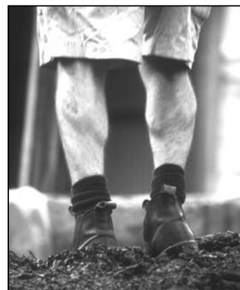
Fodtramp er reglen hos d'Arenberg, berømt for duftende, magtfuld vin.