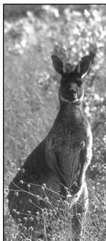
En kænguru midt i d'Arenbergs gods.