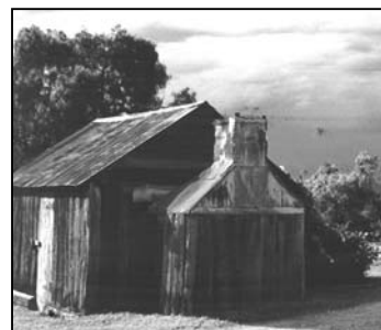
Nær Sydney kan man besøge Tyrrell's gamle vinhus -hovedsæde siden 1858

Derfor bruges fodtramp og gæring i små åbne kar samt malolaktisk gæring i egefade, store som små. Der laves et væld af vine, alle af fremragende kvalitet.