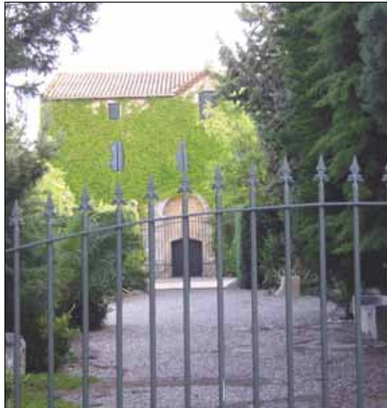
Ch. Prat de Cest stammer helt fra 1100-tallet og anses for et af de førende slotte i Corbières.