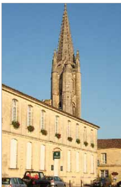
Den smukke by St.Émilion er den smukkeste by i Bordeaux-området.