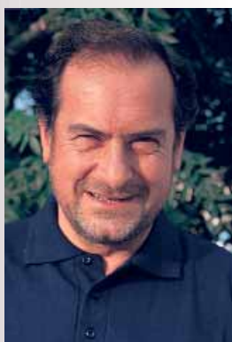
Michel Rolland: "Vinen laves som 1.Cru -intet er sparet..."

"Dette er mit mål -at skabe Argentinas bedste vin" -Michel Rolland